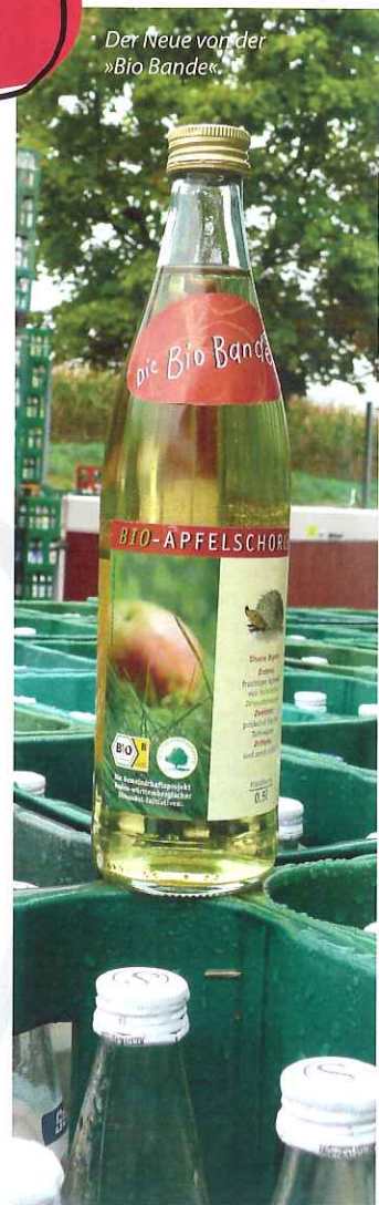
Der Neue von der »Bio Bande«.