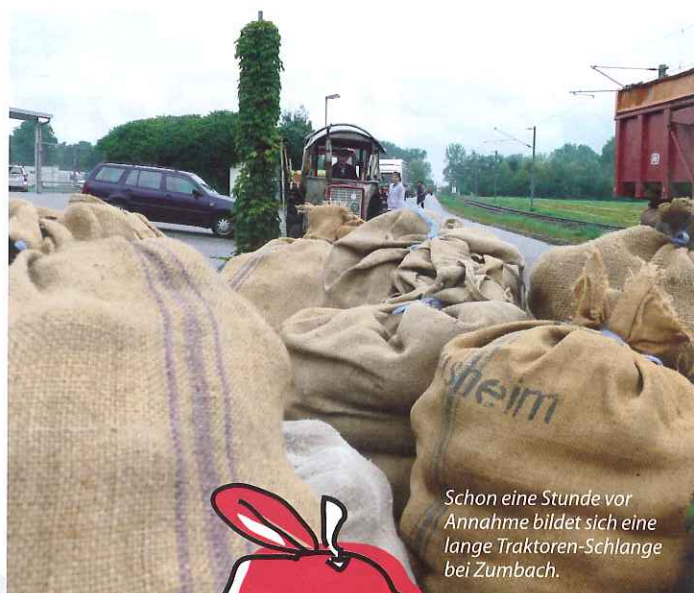
Schon eine Stunde vor Annahme bildet sich eine lange Traktoren-Schlange bei Zumbach.