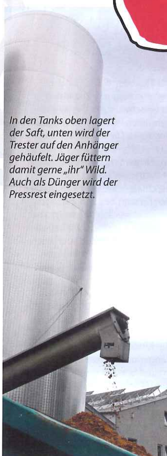
In den Tanks oben lagert der Saft, unten wird der Trester auf den Anhänger gehäuft. Jäger füttern damit gerne „ihr“ Wild. Auch als Dünger wird der Pressrest eingesetzt.