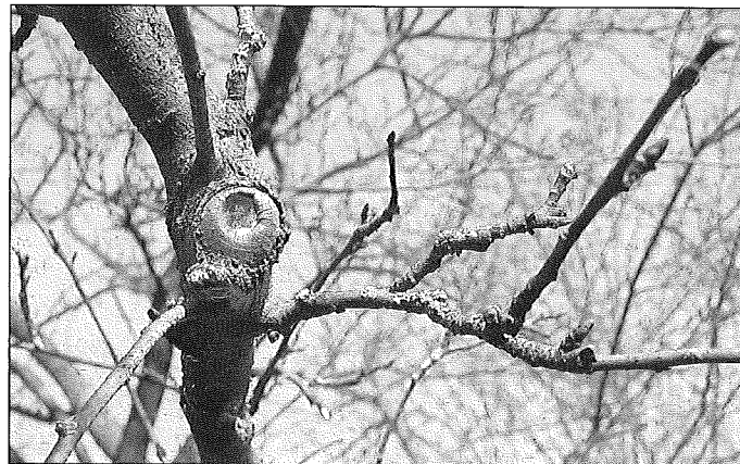
Beispiel einer ordentlichen "Wundheilung" beim Apfelbaum

obstwiesen mit den vielen Obstbäumen. An einem Apfelbaum zeigte Flinspach den Anwesenden, wie der Baum bei einem guten und glatten Schnitt seine „Wundheilung“