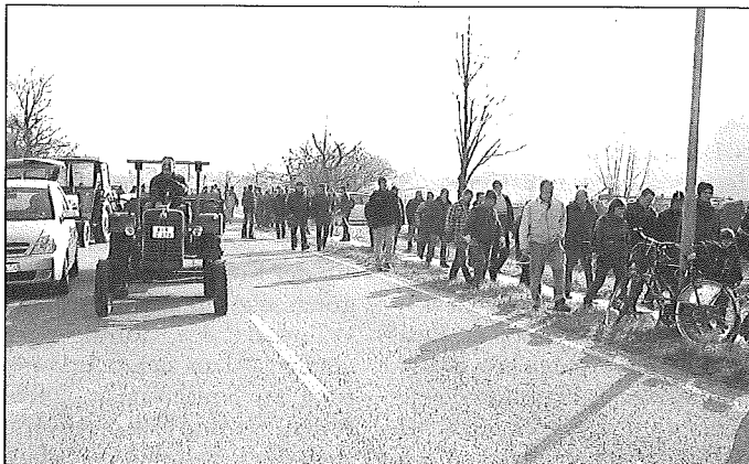
Rund 70 Teilnehmer machen sich auf den Weg zum Baumschnitt

Danach zogen sich dann mehrere Gruppen jeweils an andere Bäume zurück und versuchten unter fachkundiger Leitung von Flinspach Helfern ihr Werk anzugehen. Schnell zeigte sich, wie zeitaufwändig so ein ordentlicher Baum-