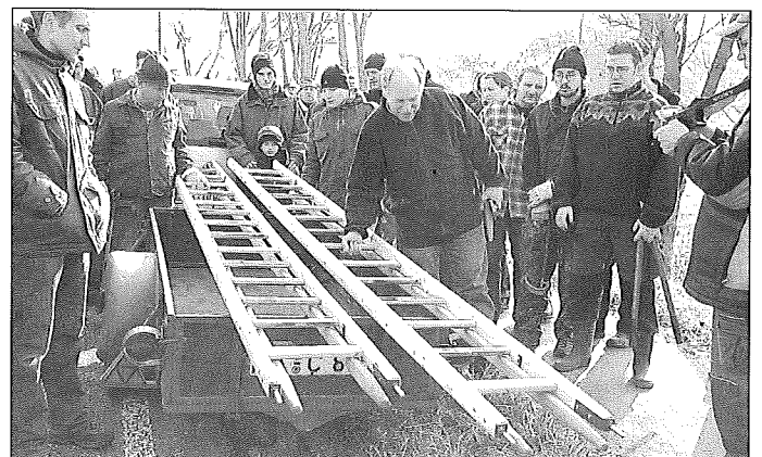
Spezielle, sichere Leitern werden begutachtet