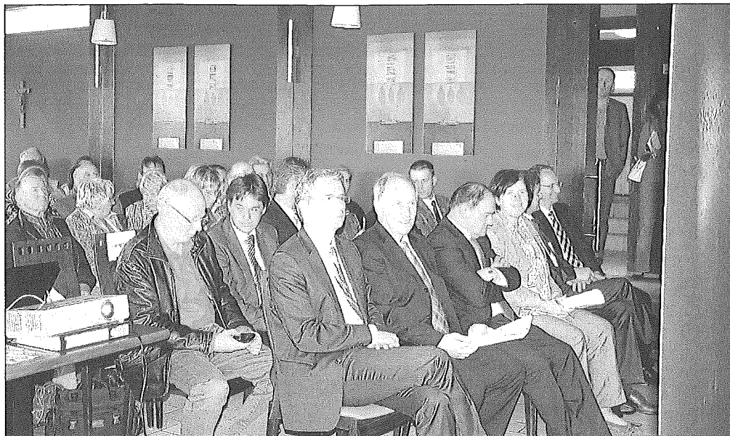
Jubiläumsgäste waren zahlreiche Persönlichkeiten aus Politik, Verwaltung und Wirtschaft

(coo). Mehr als 100 Gäste erlebten ein eindrucksvolles Programm zu einem Jubiläum, das sonst eigentlich nicht gefeiert wird.